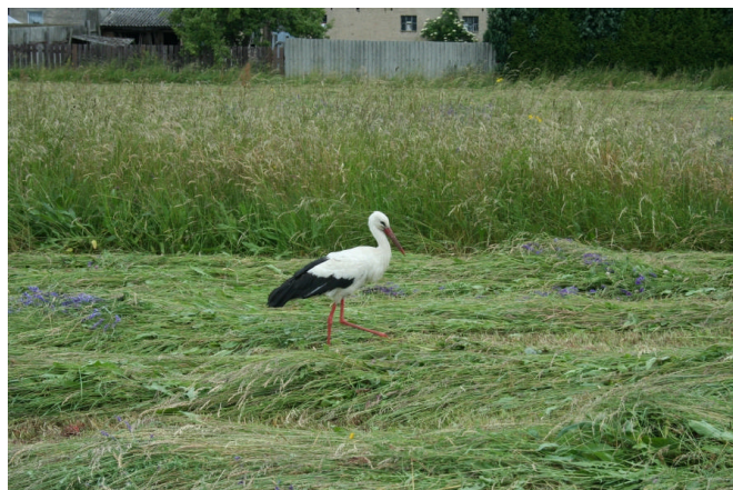
2010: Storch auf der Sensthofwiese