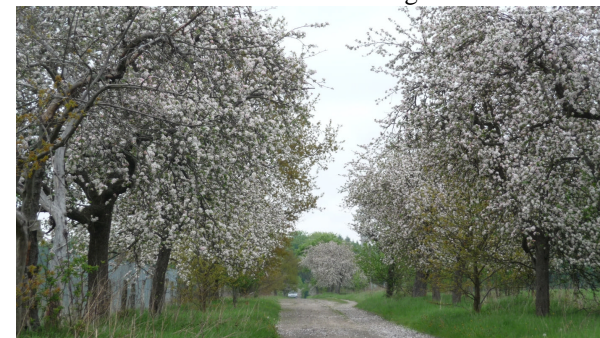
Obstbaumallee in Schmerwitz

Eine „Allee der vergessenen Obstbäume“ aus seltenen Apfel- und Birnensorten entlang des Feldweges leistet einen Beitrag zum Erhalt alter Nutzpflanzen und kann in Zukunft Streuobst für die Herstellung von Saft liefern.