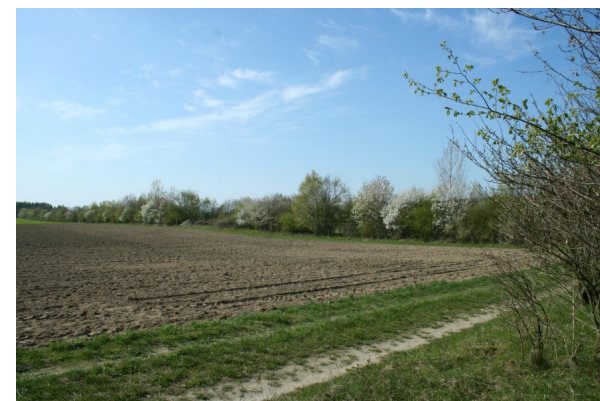
Feldhecken in Schmerwitz

Die Feldhecken werden aus über 30 verschiedenen Arten von heimischen Gehölzen bestehen, die durch ihre Blüten und Früchte vielen Vögeln- und Insekten Nahrung bieten. Im Dickicht der Hecken finden sie Schutz und können Nistplätze anlegen. Ausgewachsene Hecken dienen als Windschutz und wirken damit der Austrocknung und der Erosion des Bodens entgegen.